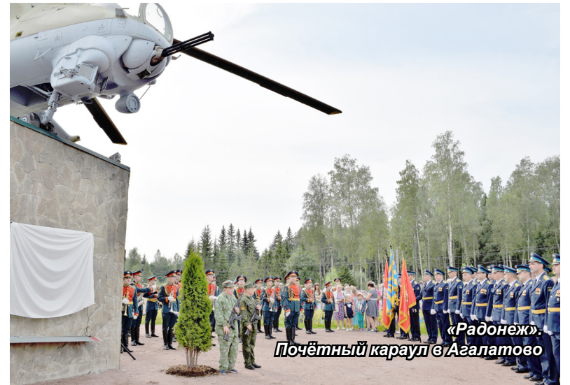
«Радонеж». Почётный караул в Агалатово

Уважать решения ребёнка, рассказывая о том, что может за ними последовать. По максимуму избегать ссор и выяснения отношений. Стараться