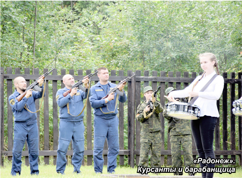
«Радонеж». Курсанты и барабанщица

В двух отделениях «Радонежа» под руководством пяти инструкторов обучаются около 60 детей. Основная сфера деятельности – это военно-патриотическое воспитание курсантов, но, по сути, мальчишек учат быть мужчинами – нести ответственность, уметь защищать свой мир, быть сильными и выносливыми, уметь ориентироваться при любых обстоятельствах, держать голову холодной, принимая решения, проанализировав и оценив все составляющие ситуации, работать руками, понимать мир. Курсанты клуба принимают участие в торжественных публичных мероприятиях; каждый год в День ВВС в Агалатово Всеволожского района воспитанники «Радонежа» несут почётный караул,